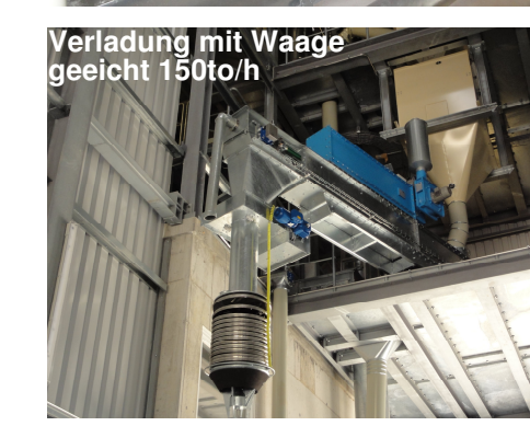
Verladung mit Waage geeicht 150to/h