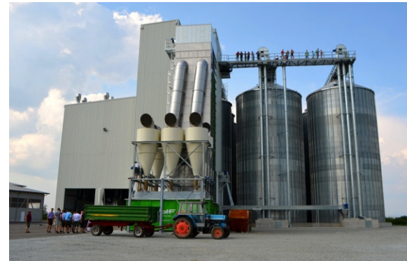
Ansicht Trockner und Silo