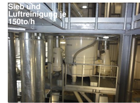
Sieb und Luftreinigung je 150to/h