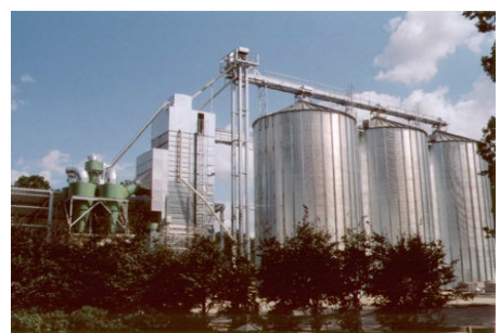
Trocknungslager, Steinfeld, Pöhlking