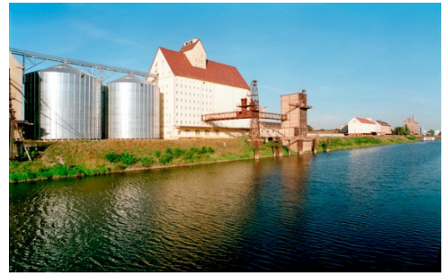
Hallische Getreide, Halle 2x 5000 to