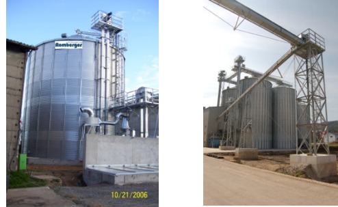
Biogasanlage Krippelna Malzfabrik, Riedenburg