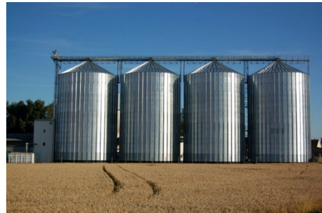
Unser Lagerhaus, Geinberg