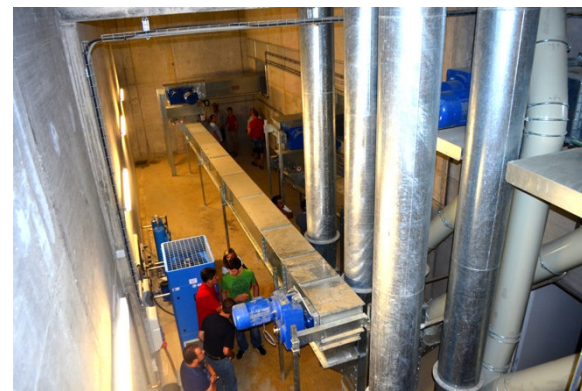
Annahme- und Verbindungsredler mit Gurtbecherwerk