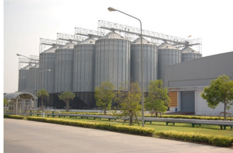
Shinga Brauerei, Bangkok