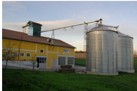
Lagerhaus Metz, Haag (Österreich)