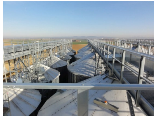
Silolaufsteg 2m und 2,5m Breite