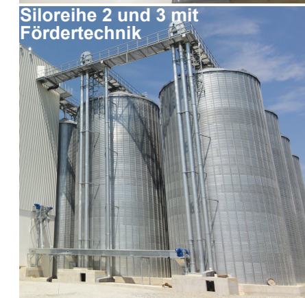
Siloreihe 2 und 3 mit Fördertechnik