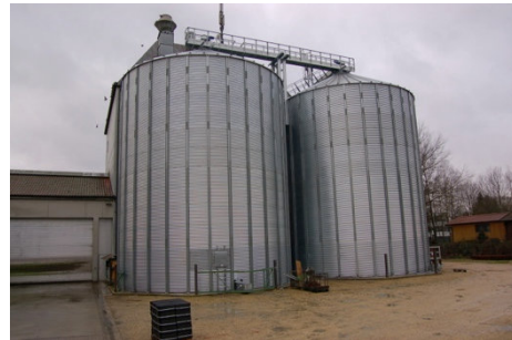
Raiffeisen Lagerhaus, Essenbach

Bestellt unsere Erzeugnisse ständig zu verbessern, behalten wir uns das Recht vor, Änderungen ohne vorherige Benachrichtigung vorzunehmen. Der Lieferumfang ergibt sich ausschließlich aus Ihrem Auftrag, SA 0814