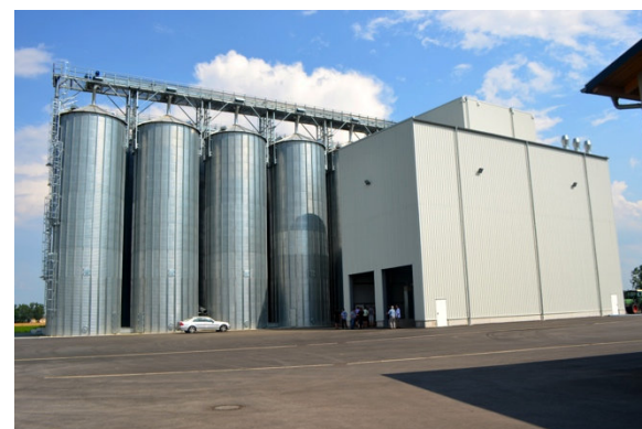
Annahmehalle mit Silos