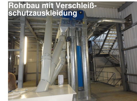
Rohrbau mit Verschleißschutzauskleidung