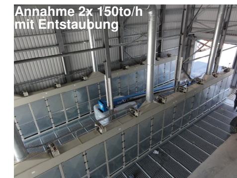
Annahme 2x 150to/h mit Entstaubung