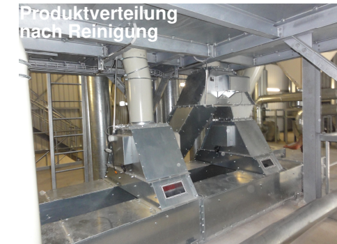
Produktverteilung nach Reinigung