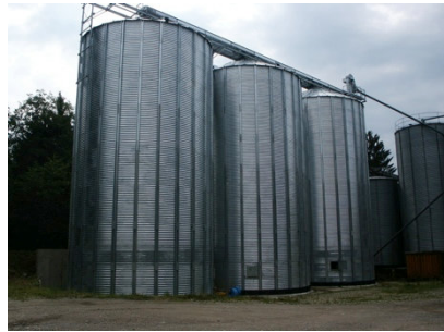
Kunstmühle Weiß, Bruckmühl